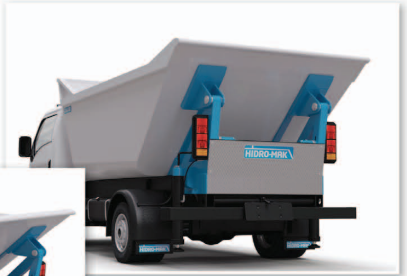
Mini damper standart tip Mini dump standart type