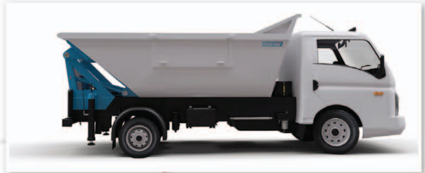
Mini damper yandan kayaklı tip Mini dump with side door